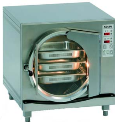
SoVita 3 + 9